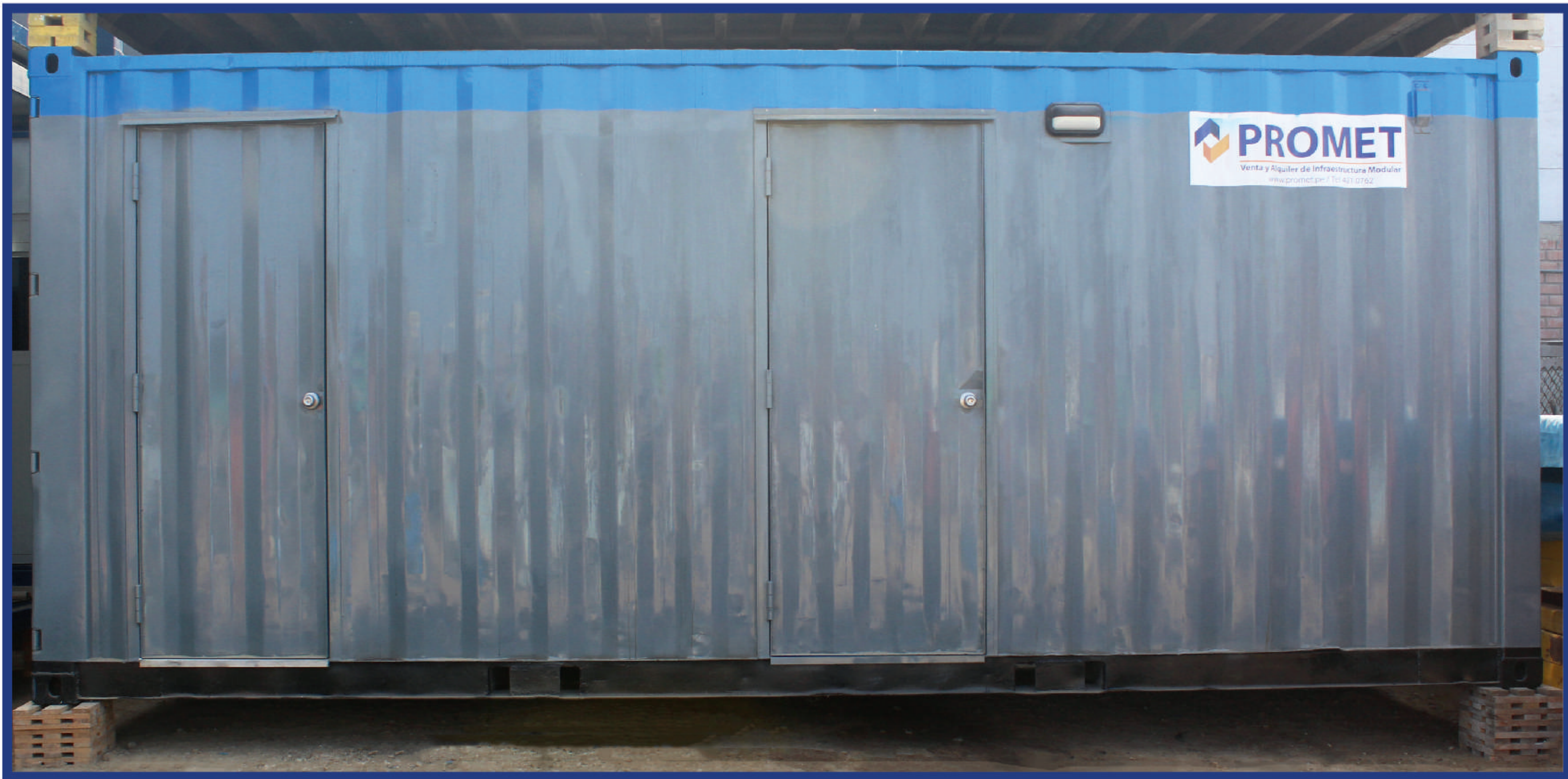
SS.HH - Mixto